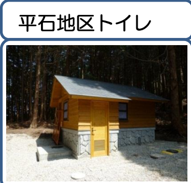
H23に完成した木造トイレです。汚水を外に出さない土壌処理型。