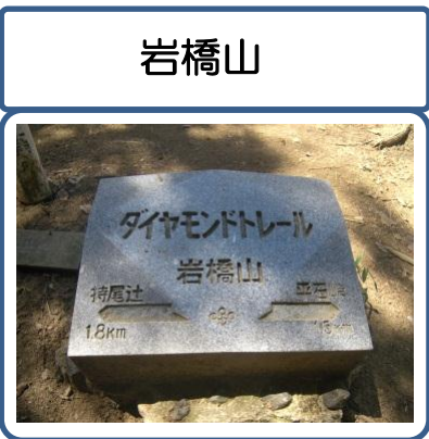
標高658.8m。山頂付近は、美しく植林された針葉樹の美林が広がっています。