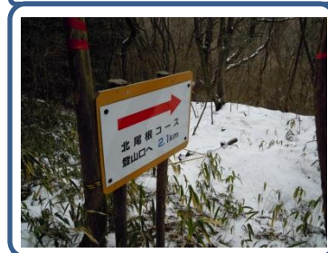
別名「秋津洲展望コース」御所市域が良く見えます。