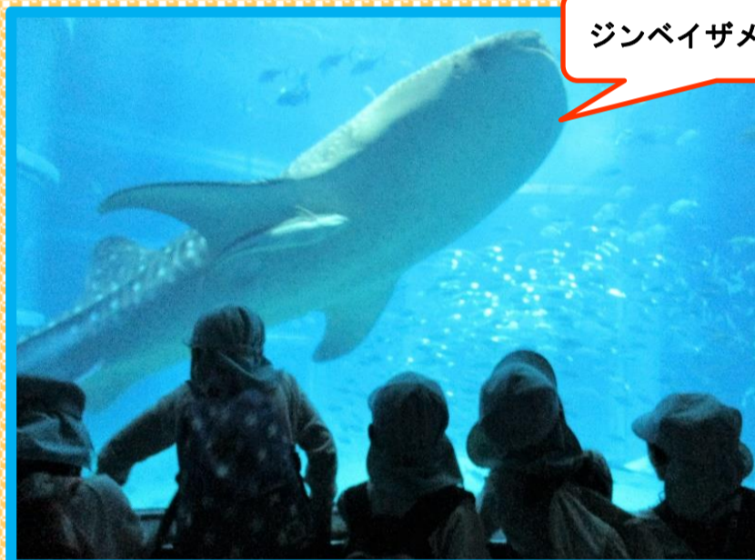
ジンベイザメ大きい〜