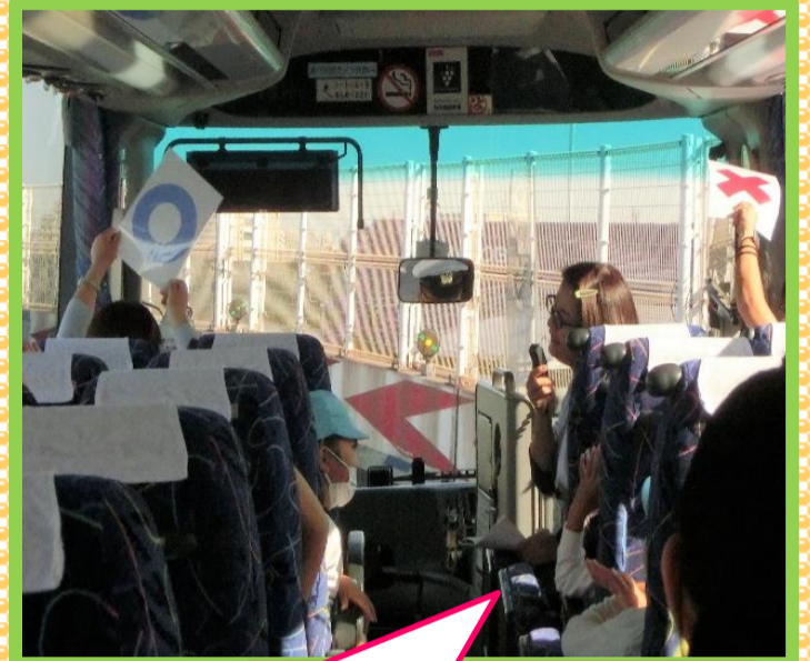
バスの中でクイズをしたよ♪