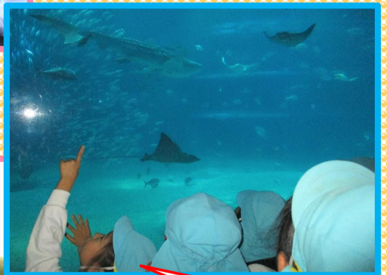
あそこにもお魚いるよ～