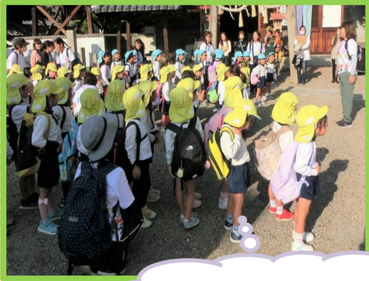
園長先生のお話を聞いて、さあ出発!