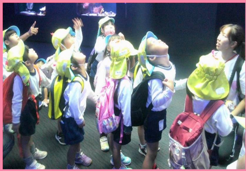
タカアシガニとにらめっこ(-ω-)