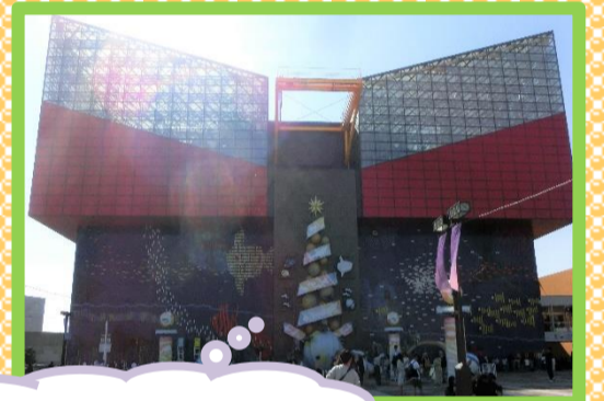
さあ海遊館に到着♪