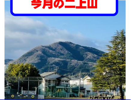
元旦の二上山です。