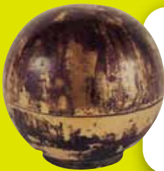
※写真は威奈大村骨蔵器のレプリカ

ガラス越しでは観察できない細部まで鑑賞できるのは3Dモデルならではの。国宝★の威奈大村骨蔵器を、3Dでじっくりと観察してみよう！骨蔵器の中は、どうなってるのかな？