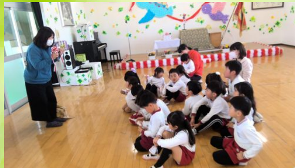
園長先生から育友会さんから準備していただいたプレゼントいただきました。にじさんの卒園まであと3日となりました！園でたくさん遊んで先生や友達といっばい笑って過ごしたいと思います🌈