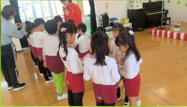
お互いのことを思い合っ—生懸命作りました😊