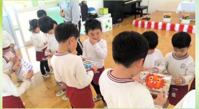
「もっと一緒に遊びたいね🐱」