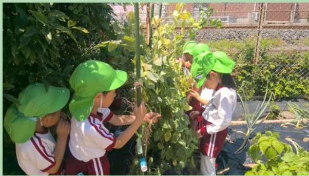
幼稚園の畑にできたえんどう豆を収穫しました。