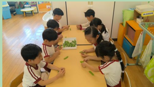
皮をむくとかわいい豆がぎっしり詰まっています。みんなていねいに豆をむいてくれました。