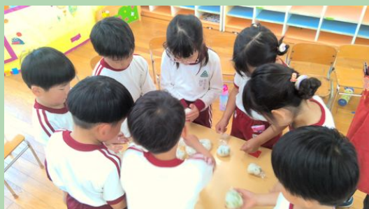
ほし組さんが、「アチチ～」といいながらラップでおにぎりをにぎってくれました。