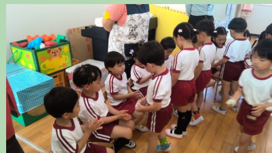
うさぎ組さん、できたよ。「はいどうぞ」「ありがとう。おいしそう～」