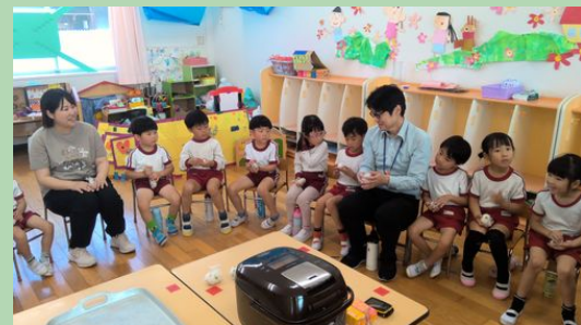
園長先生やみんなの先生と一緒に食べた豆ごはんは、とってもおいしかったですね。