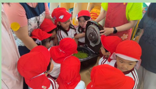
お米を洗って、豆を入れて、お塩で味付け。さあ、できあがりを楽しみます。