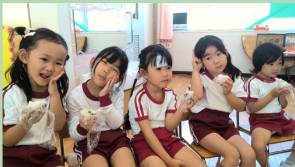
「う～ん、とってもおいしい～」